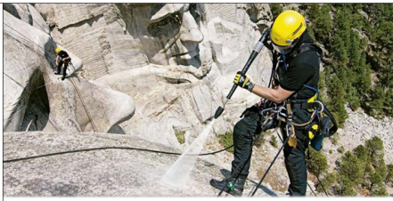
Startseite pit-FM Mobile der Alfred Kärcher SE & Co. KG

Alfred Kärcher SE & Co KG Alfred-Kärcher-Straße 28-40 71364 Winnenden/Deutschland